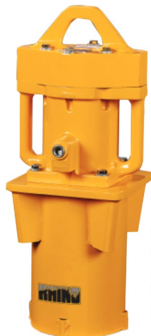
070758 Chuck Maestro de 17.8 cms (7") incluido en el controlador