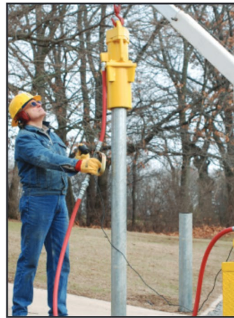
Chuck Maestro de 17.8 cms (7"), No. de parte 070756, acoplado a un poste de acero.