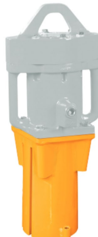
070598 Chuck Ranurado para Tablaestacas