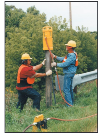
Chuck Maestro de 15.2 x 15.2 cms (6" x 6") No. de parte 070761, acoplado a un poste de madera.