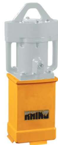
070761 Chuck Maestro para poste de madera de 15.2 x 15.2 cms (6" x 6")

Las intrucciones de cambio rápido de Chuck que se incluyen en la caja, facilitan el cambio entre Chucks Maestros.