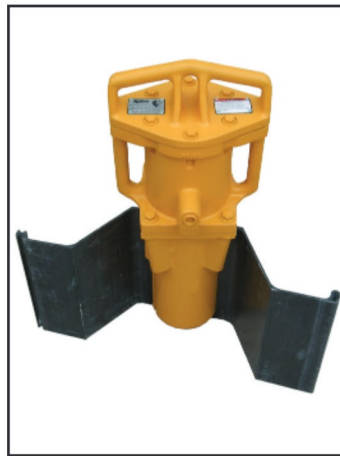
Se muestra un hincapostes con una tablaestacas insertada en el Chuck.